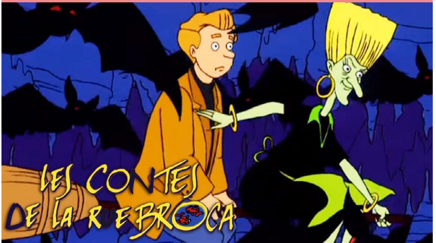
Contes de la rue Broca, 26 épisodes de 13 minutes, série créée par Alain Jaspard et Claude Allix

La rue Broca est une artère réelle du 13 e arrondissement de Paris. Gripari lui confère dans sa préface un statut particulier : «La rue Broca n'est pas une rue comme les autres.» Elle fonctionne dans le recueil comme un espace-seuil, un passage entre le monde ordinaire et le monde merveilleux. C'est là que se retrouvent, autour de la boutique de Papa Saïd – l'épicier du quartier – les enfants du voisinage, dont Bachir et sa sœur Nadia, personnages récurrents de plusieurs histoires. C'est là également que le mystérieux Monsieur Pierre, figure fictive de l'auteur lui-même, recueille et invente les contes avec les enfants chaque jeudi après-midi.