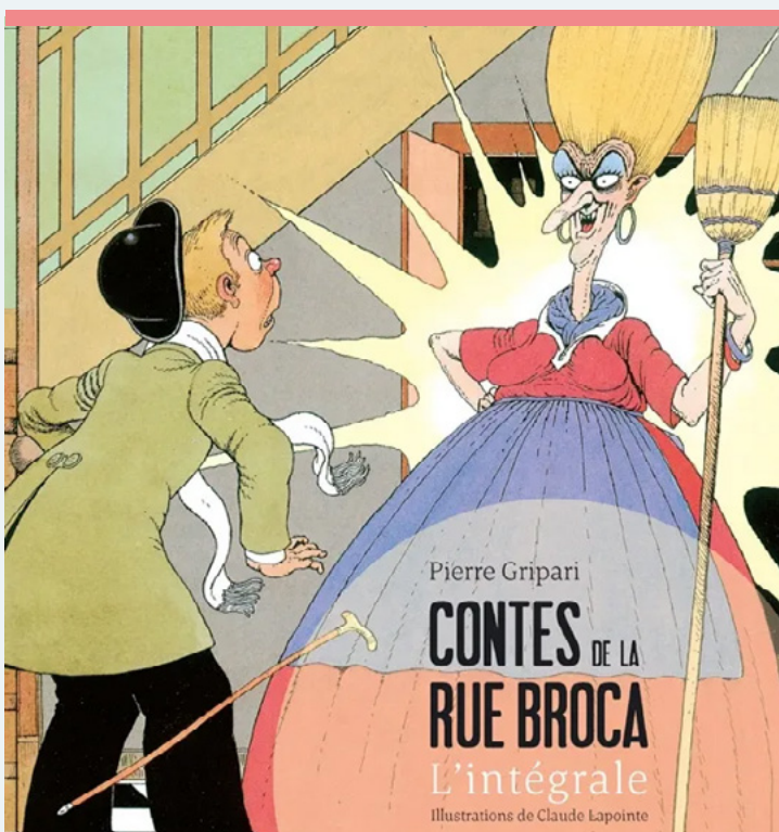
Contes de la rue Broca : l'intégrale (Grand format - Relié 2012), de Pierre Gripari, Éd. Grasset Jeunesse

Il se consacre à l'écriture au prix d'une longue période de précarité matérielle. Il publie des pièces de théâtre, des romans, des nouvelles et des essais, dans un style marqué par l'humour, l'absurde et un rapport singulier au fantastique. Ce n'est qu'avec les Contes de la rue Broca , parus en 1967 aux Éditions de la Table Ronde, qu'il accède à la reconnaissance du grand public. Traduits dans le monde entier et inscrits au programme de l'Éducation nationale, ces contes ont assuré à leur auteur une notoriété durable, même si Gripari demeura toute sa vie dans une grande précarité. Il décède le 23 décembre 1990 à Paris.