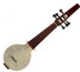
Le Rabâb, vielle jouée de façon verticale.