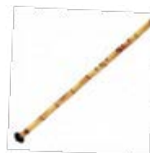
Le Nay, flûte en roseau, qui ornemente la mélodie.