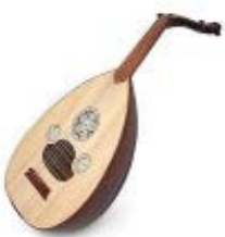
Le Oud, ancêtre du luth baroque, il accompagne le chant.

Traditionnellement joués par les hommes, les instruments de musique arabe sont très variés. On trouve principalement, dans toute la sphère arabophone :