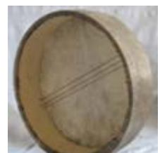
Le Bendir, tambourin à timbre, il marque les accentuations rythmiques.